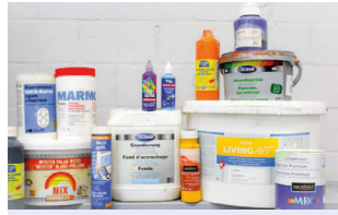
Peintures sans solvant