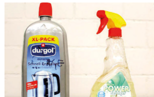
Produits chimiques liquides