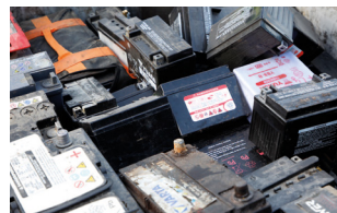
Piles et accumulateurs au plomb