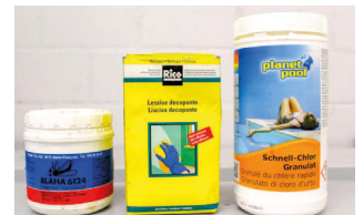
Produits chimiques solides