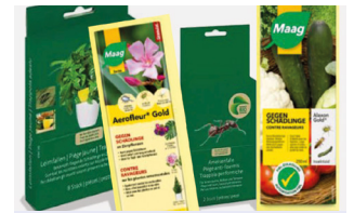
Phytoprotecteurs (pesticides) solides