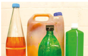
Déchets liquides non identifiables