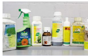
Phytoprotecteurs (pesticides) liquides