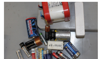
Piles et accumulateurs mélangés