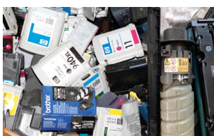
Déchets de toner d'impression