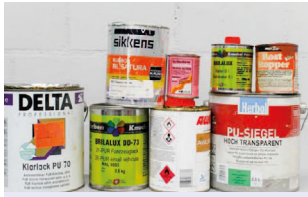
Peintures avec solvant